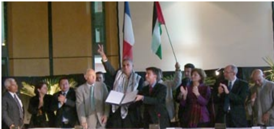
Signature de l'accord de coopération à l'Hôtel de Ville d'Evry en présence de Mme Hind Khoury, Déléguée Générale de la Palestine en France

La signature par la ville d'Evry d'un accord de coopération avec le camp de réfugiés de Khan-Younis incarne la volonté de marquer, fortement et symboliquement, son engagement solidaire avec ce peuple de Palestine, riche de ses traditions et de sa culture.